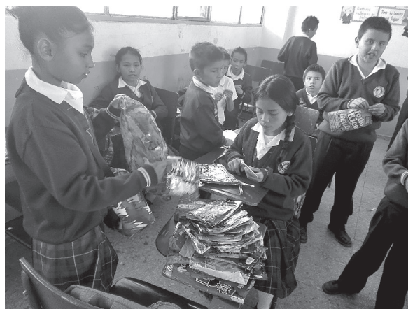
Figura 7. Reciclando y reutilizando empaques.

También, el día 27 de septiembre, se realizó una clase integrando los grados 4-1 y 5-4, cada estudiante de estos grupos llevó 150 empaques de frituras, previamente lavados para armar aros y centros de mesa como adornos navideños. En esta actividad se notó el aprendizaje colaborativo y autónomo, el respeto por el ritmo de trabajo individual y se lograron excelentes resultados (Ver figuras 7 y 8).