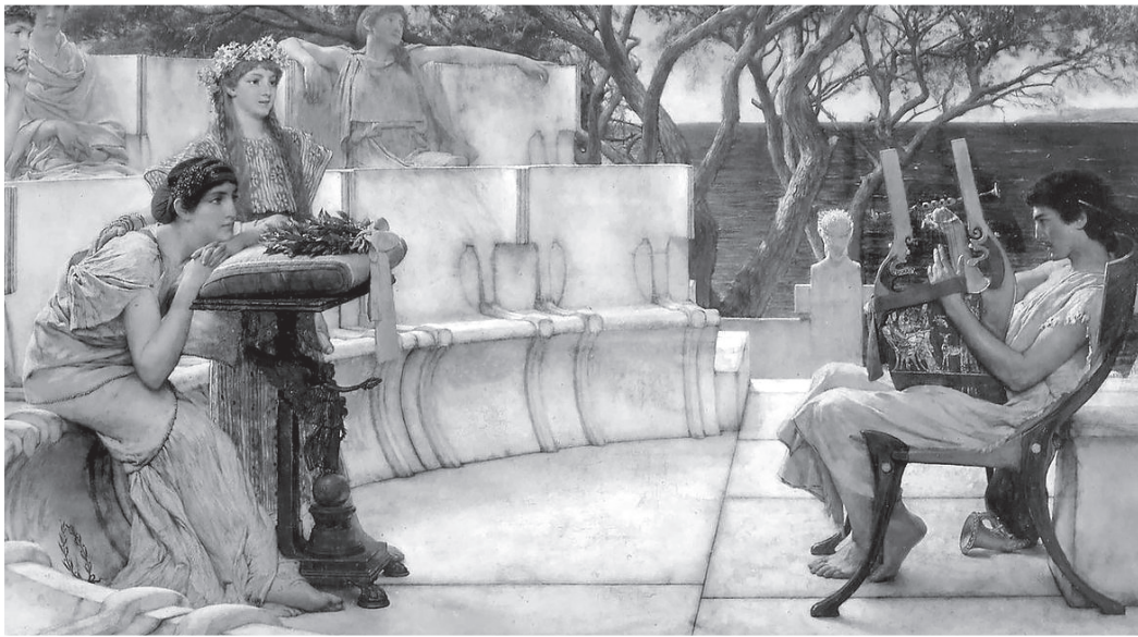
Sappho And Alcaeus (Sir Lawrence Alma-Tadema)