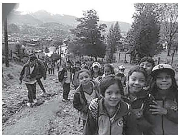
Figura 1. Sendero ecológico de la Zarza.

pareció importante porque comentaban haber observado diferentes animales: un pavo real de colores exóticos, perros de raza pastores alemanes, conejos, la araña tigre, piedras de diferentes formas y colores en el río, hongos rojos y blancos. También les impactó el cauce y el sonido del río. (Ver figuras 1 y 2).