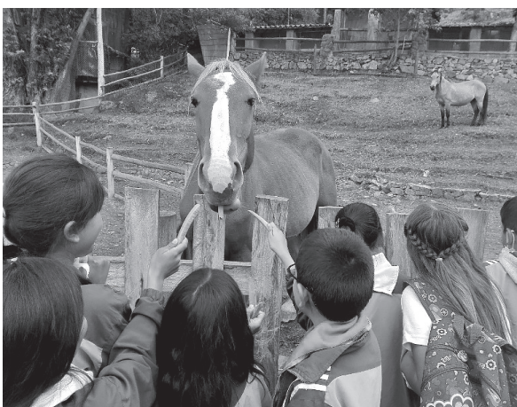
Figura 5. Salida Parque natural Guátika.