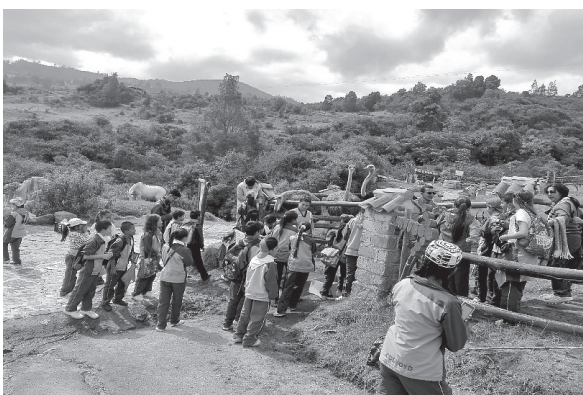
Figura 6. Interacción con animales.