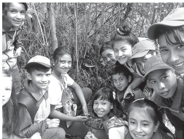
Figura 2. Estudiantes observando los hongos.