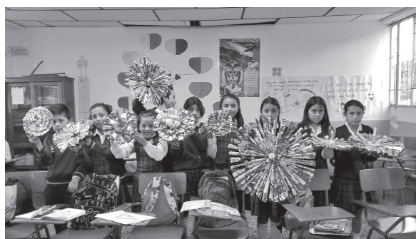
Figura 8. Adornos navideños.