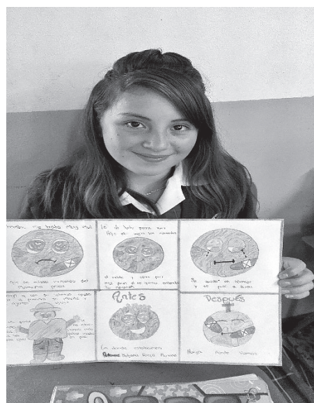
Figura 3. Comparación de la tierra.

biografía del autor, discutieron el título, ilustraron frisos e historietas, se creó un poema a la tierra, una obra de teatro y aprendieron a cantarla. (Ver figuras 3 y 4).