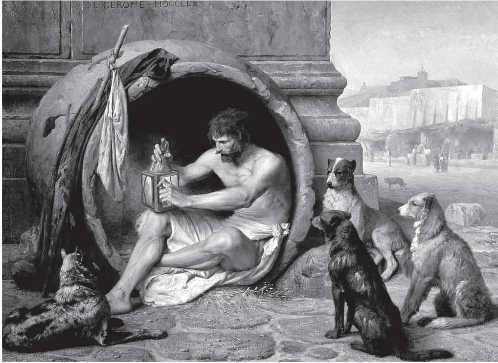
Diógenes (Jean-León Gérôme)