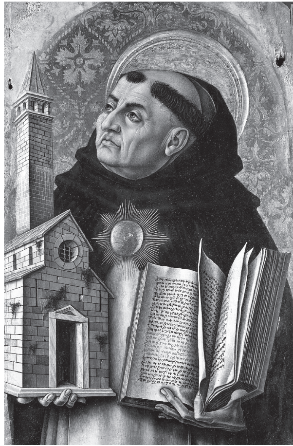
Santo Tomás de Aquino (Carlo Crivelli)